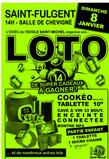
(affiche en pièce jointe)